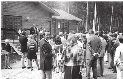
Eröffnung des Clubhauses 26. Juni 1972.